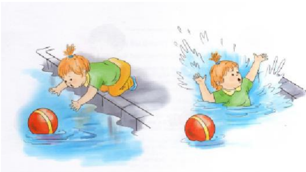
Рис.3 Иллюстрация для задания 2.2.

Рассмотри картинку (рис.3). Расскажи, что на ней изображено? Как нужно вести себя на улице? Что делать, если мяч попал в речку или пруд?