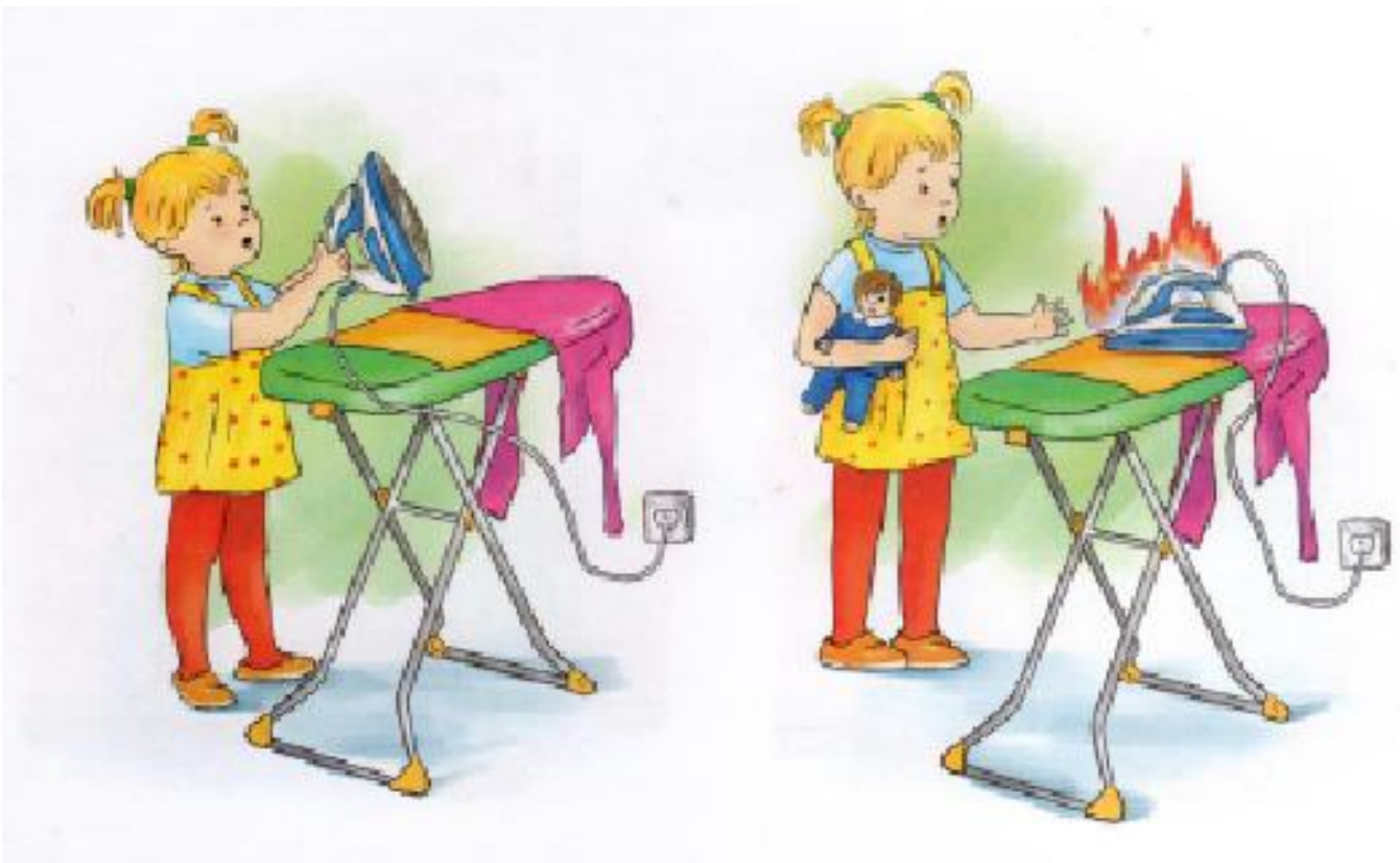
Рис.5 Иллюстрация для задания 3.2.

Рассмотри картинку (рис.5). Расскажи, что на ней изображено? Как нужно вести себя с электроприборами?