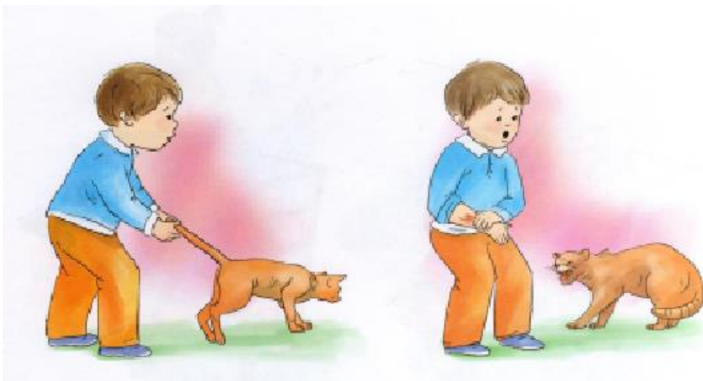
Рис.2.1 Иллюстрация для задания 2.1.

Рассмотри картинку. Расскажи, что на ней изображено? (рис..2) Как нужно вести себя с животными на улице? Чего следует опасаться?