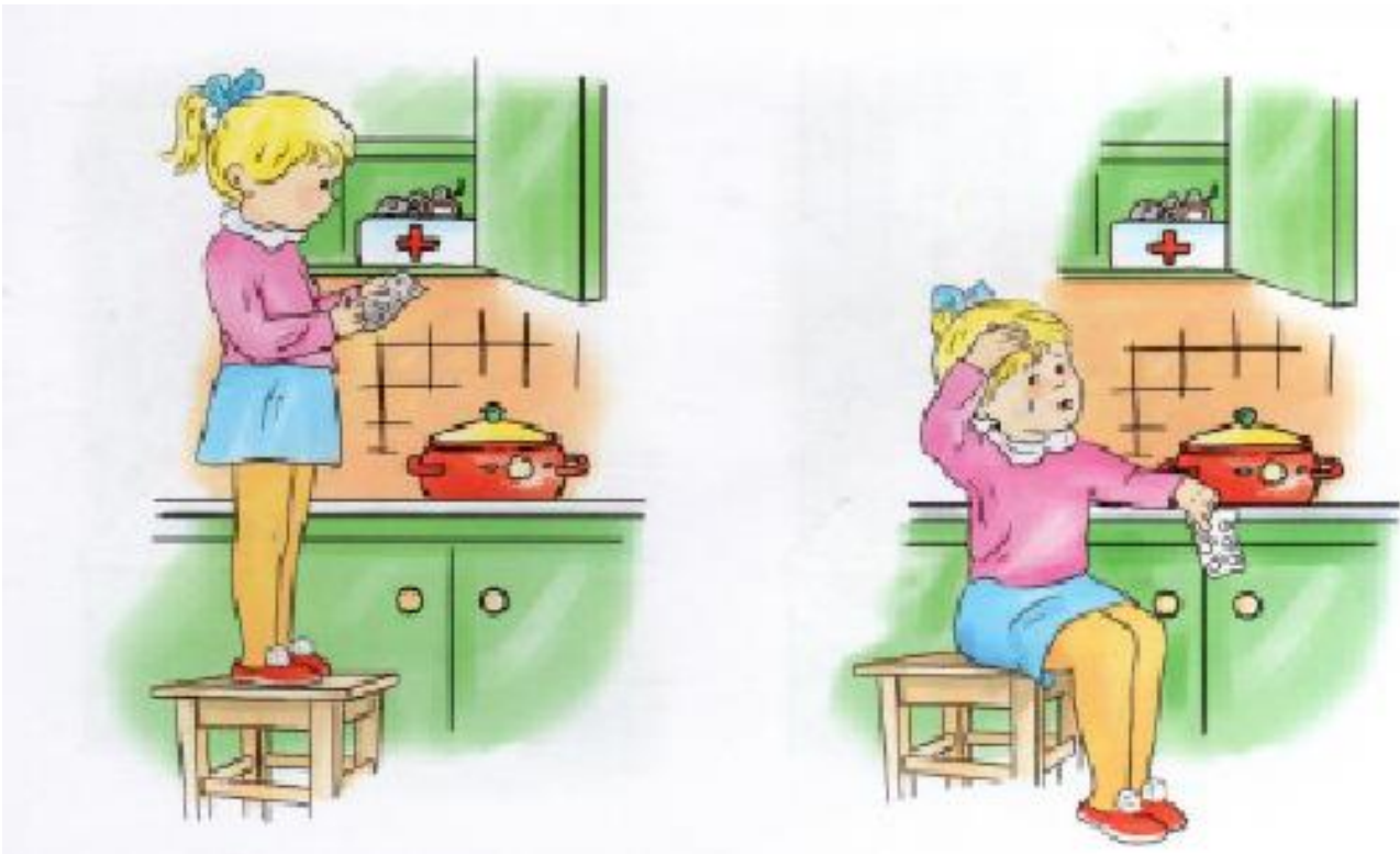
Рис.4 Иллюстрация для задания 3.1.